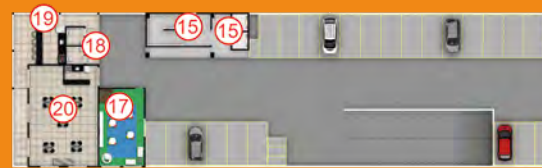
EDIFÍCIO GARAGEM - 6º PAVIMENTO