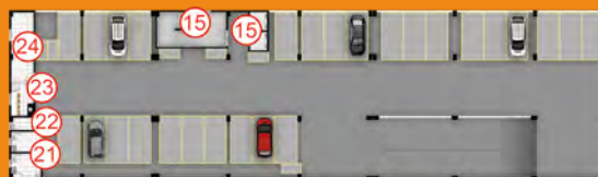
EDIFÍCIO GARAGEM - 1º PAVIMENTO