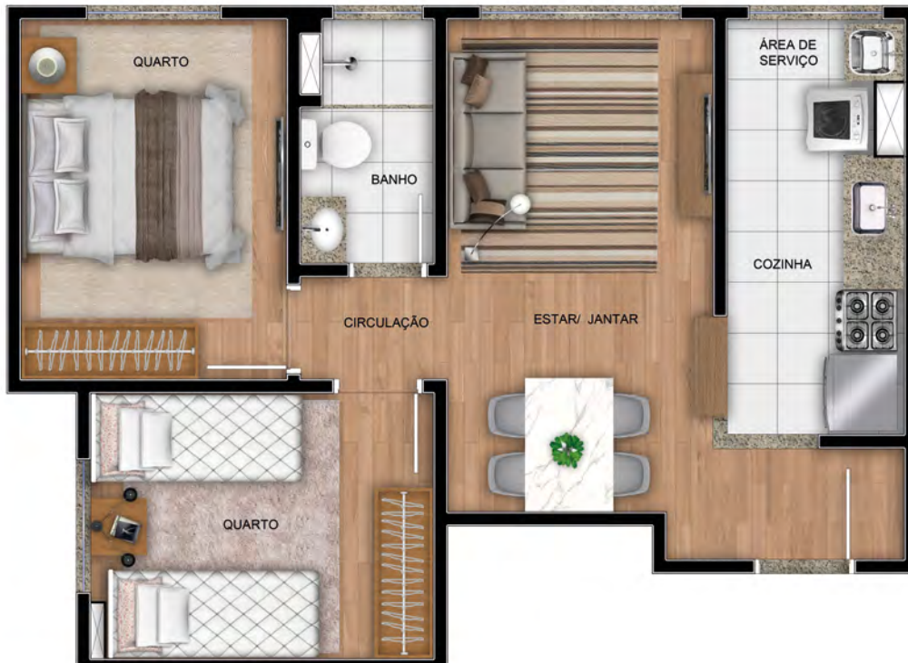
Ref.: Apto. 201 - Torre 1