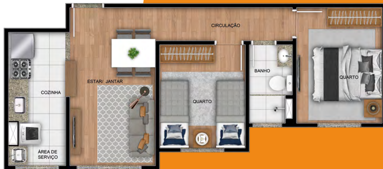
Ref.: Apto. 204 - Torre 1

Muito mais conforto no seu lar. E por muito menos no seu bolso.